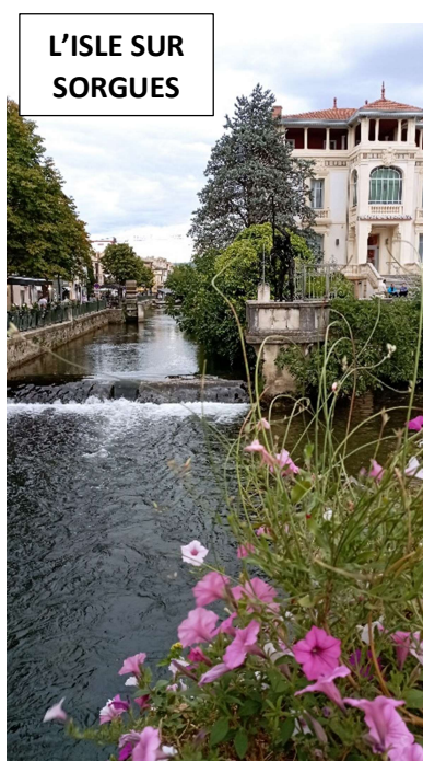
L'ISLE SUR SORGUES