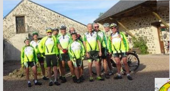
Une chaleur... Je ne vous dis pas...