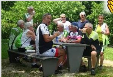
Digestion...Repos... Avant de reprendre les côtes !!!